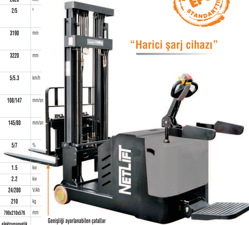
Genişliği ayarlanabilen çatalar Adjustable forks