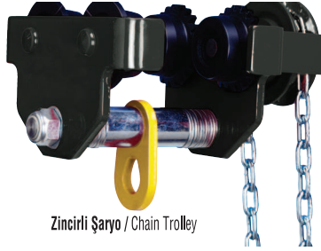
Zincirli Şaryo / Chain Trolley